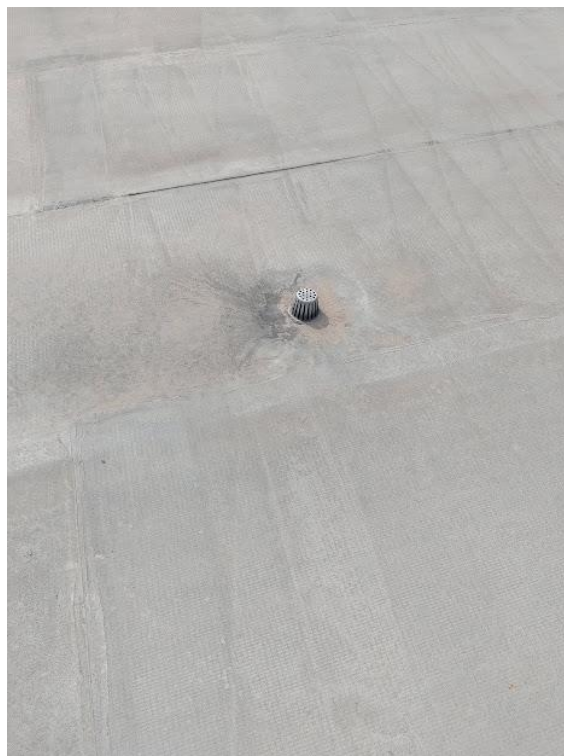
Imagen 8. Colector Ubicado en la Placa de la Cubierta Segundo Piso