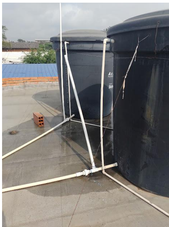
Imagen 7. Placa de la Cubierta Segundo Piso