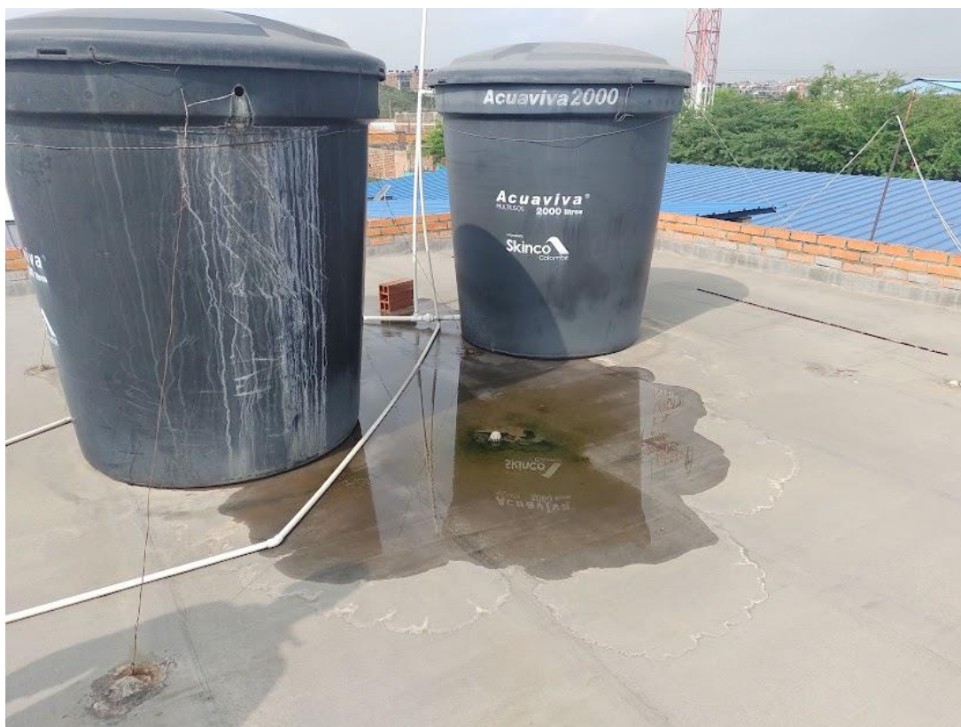
Imagen 7. Placa de la Cubierta Segundo Piso