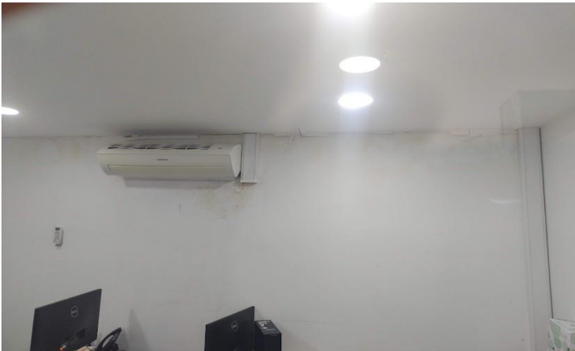
Imagen 1. Áreas comunes

A continuación, relaciono el registro fotográfico realizado en la visita evidenciando el estado actual del edificio: