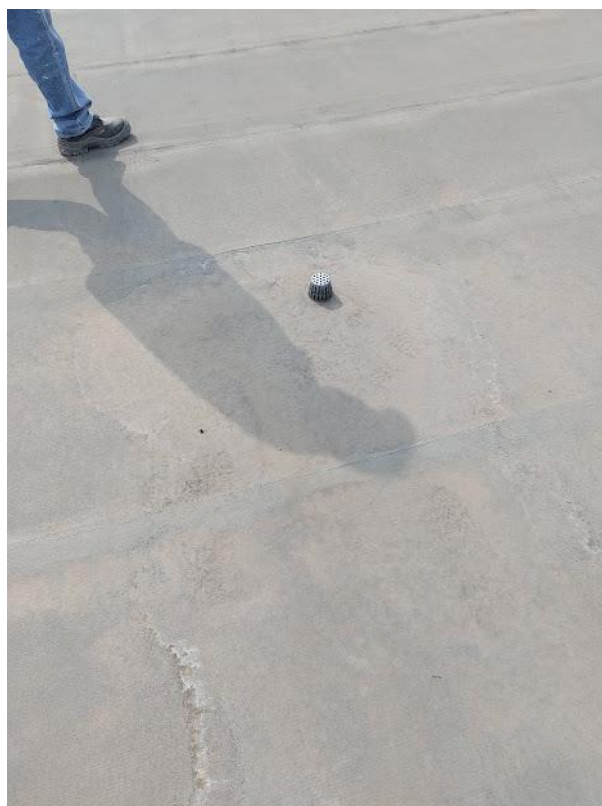
Imagen 9. Colector Ubicado en la Placa de la Cubierta Segundo Piso