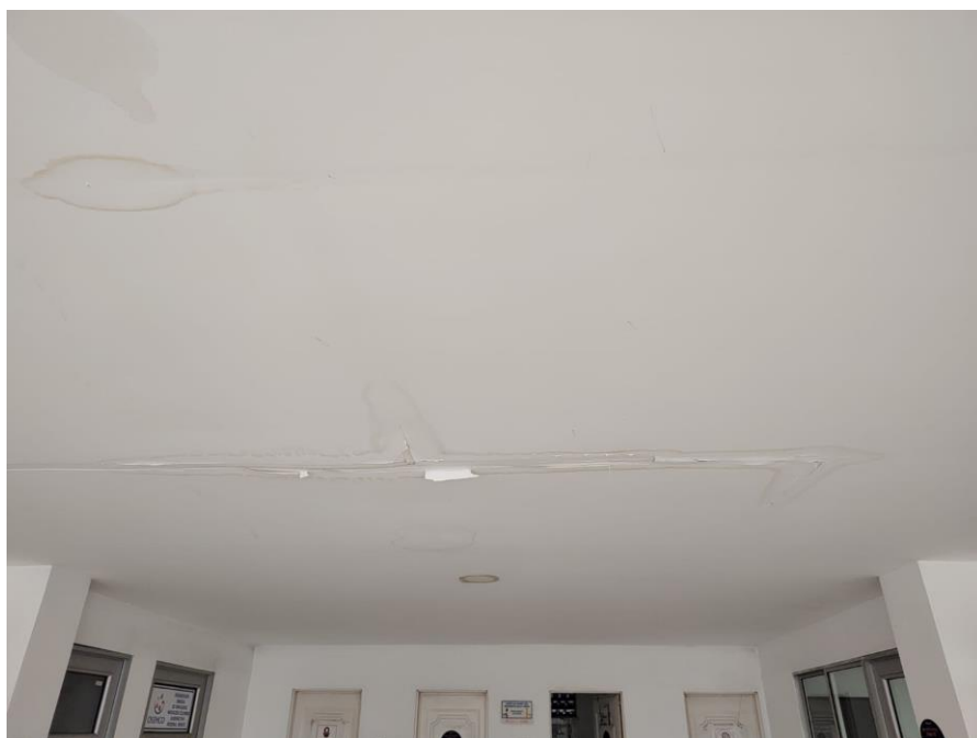
Imagen 4. Áreas comunes