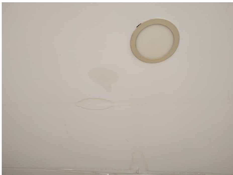
Imagen 6. Áreas comunes