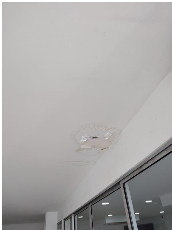
Imagen 3. Áreas comunes