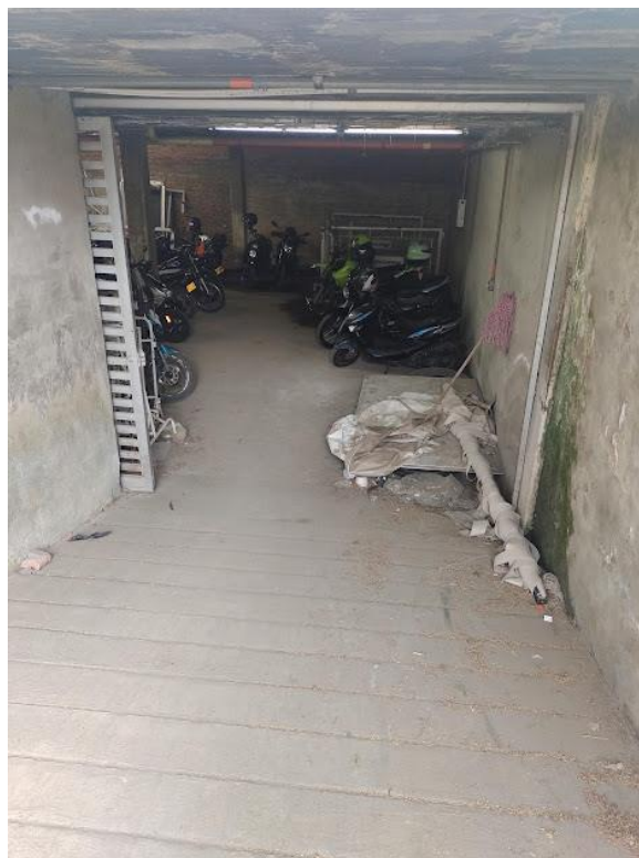
Imagen 2. Sótano