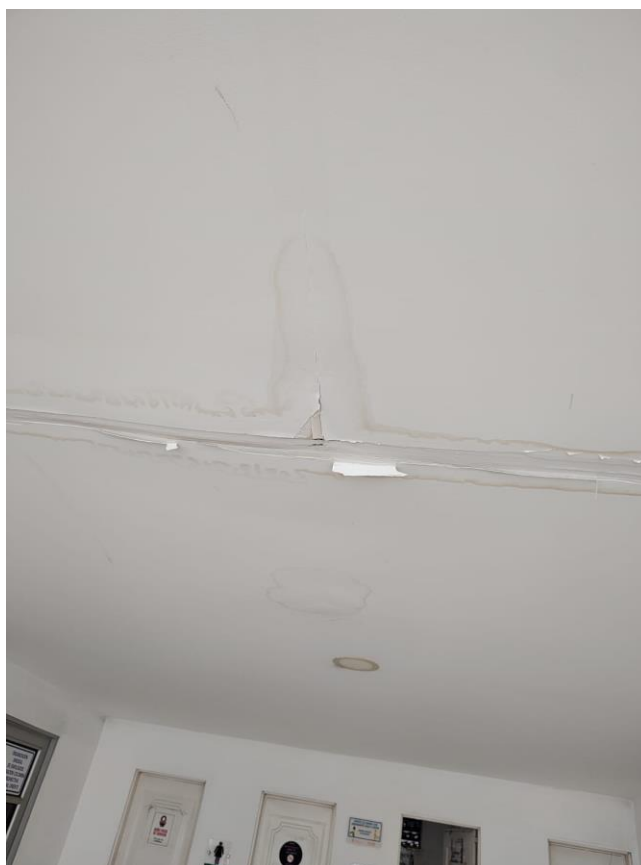
Imagen 5. Áreas comunes